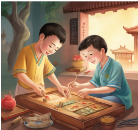
图3.利用Midjourney生成的图片示例1