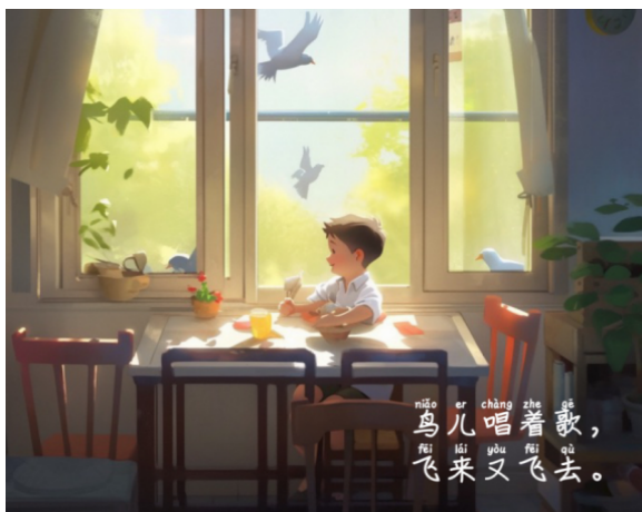
图 5. 利用 Midjourney 生成的图片示例 3

第三,针对每行诗歌在 Midjourney 中生成并挑选合适的图片,部分图片如下: